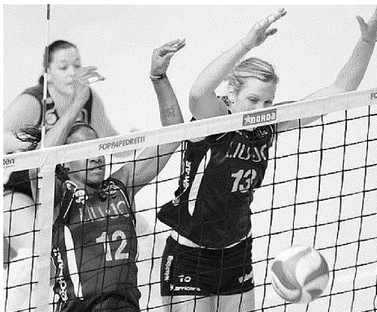
Aguero e Harmotto a muro: Modena resta sede della final four di Coppa

Modena resta sede della final four, gli accoppiamenti dei quarti: Yamamay-Parma o Novara; Chateau d'Ax-Foppapedretti, MCCarnaghi-Rebecchi Piacenza.