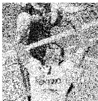
Il regista brasiliano Raphael

NOTE: Durata set: 24', 21', 21'; totale 72'. Trentino Diatec: battute sbagliate 18, vizi 10, muri 8, errori 21. Al Arabi: battute sbagliate 10, vizi 2, muri 2, errori 16.