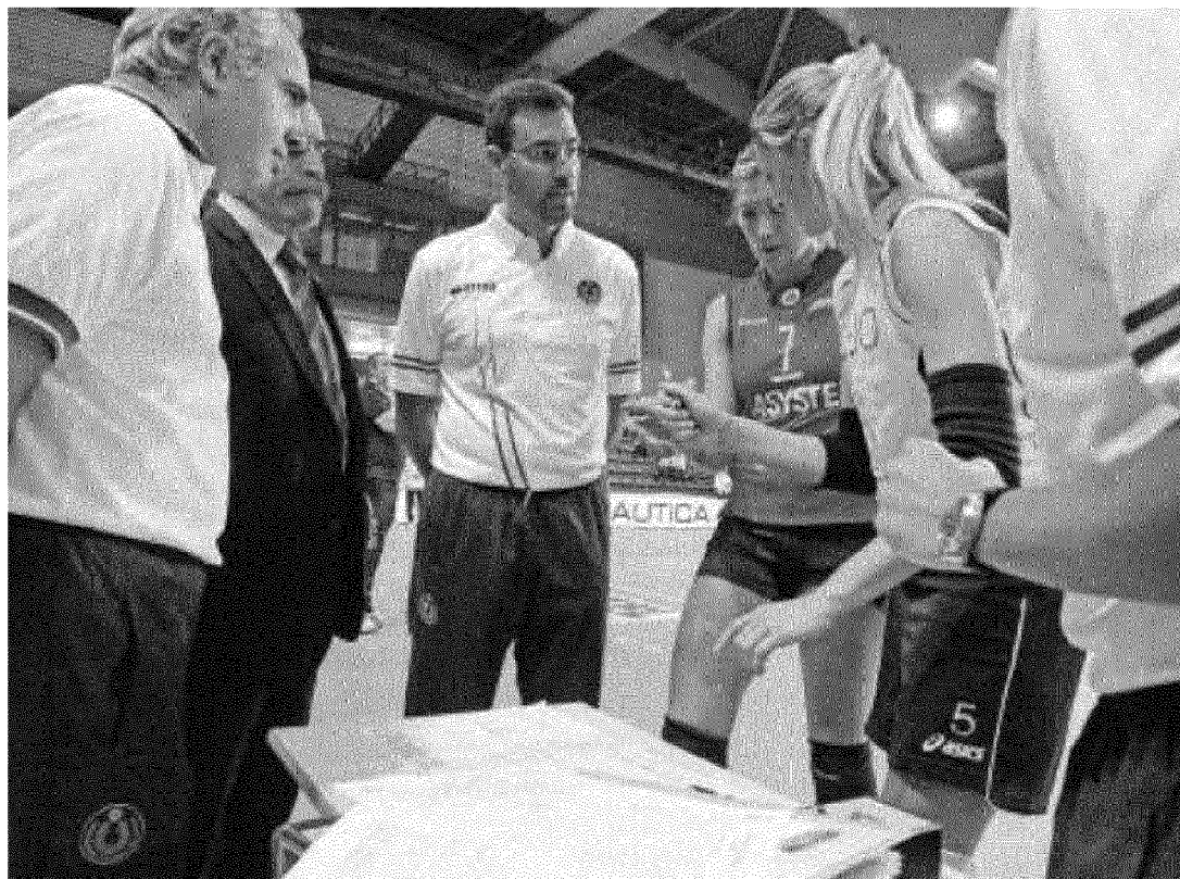
Domenica l'Asystel ha perso a tavolino la prima partita di campionato: si è presentata con sole 5 giocatrici